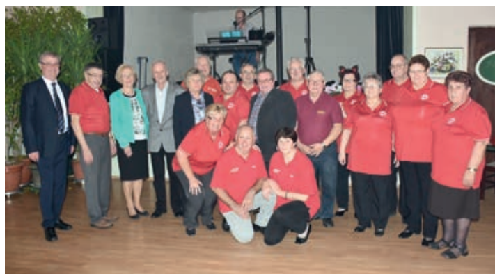
Die Vorsitzenden der Ortsorganisationen

Alle unsere Kegler konnten sich für die erste Runde zur NÖ Landesmeisterschaft 2016 qualifizieren. Wir wünschen der Sportgruppe mit unserem Gruß GUT HOLZ viel Erfolg.