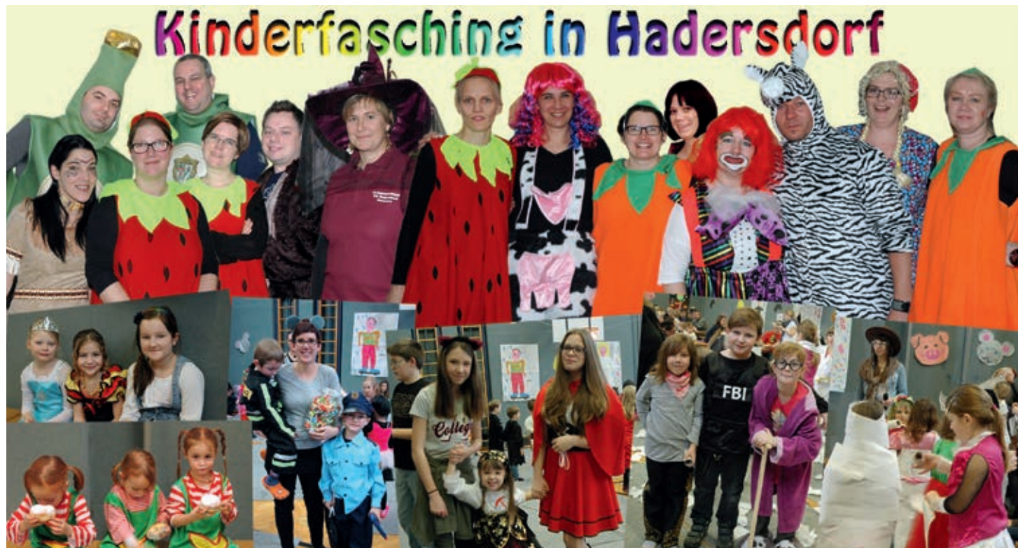
Der Elternverein der VS Hadersdorf am Kamp veranstaltete auch heuer wieder seinen traditionellen Kindermaskenball. Neben Kinderanimation, Tombola und Schätzspiel war auch für das leibliche Wohl bestens gesorgt. Die Gemeinde überraschte die Kinder wieder mit leckeren Krapfen.