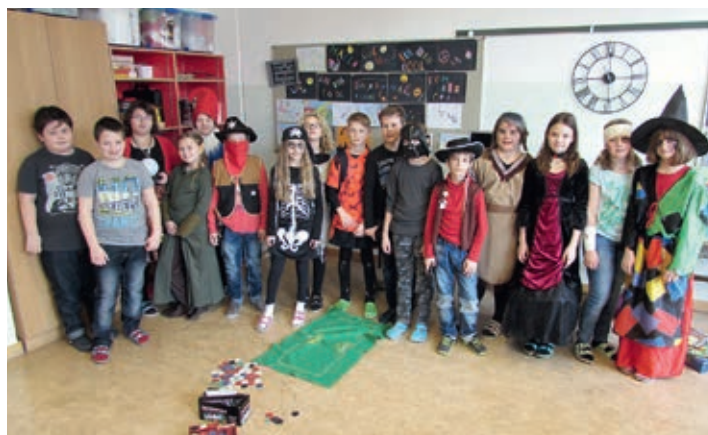
Am Faschingsdienstag herrschte in den Klassen der Volksschule wieder jede Menge närrisches Treiben und die Kinder verbrachten einen vergnüglichen Vormittag in tollen Verkleidungen in der Schule.