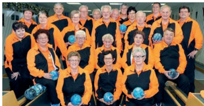
Die Damen- und Herrenmannschaft des Pensionistenvereins Hadersdorf und Umgebung