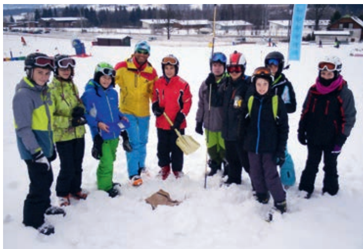
Kinder hören im Vortrag der AUVA über die Gefahren im Schnee und dürfen ihr Wissen danach praktisch anwenden.

Langlaufen kam auch die Geselligkeit nicht zu kurz. Turniere in Fußball, Tischtennis, Schnapsen und Zeichnen rundeten das Angebot ab.