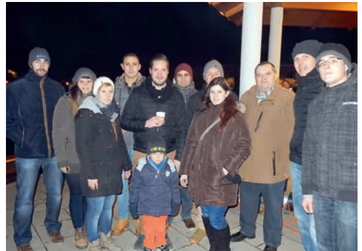
Einstimmung in den Advent

Bereits zum dritten Mal luden wir am 28. November 2015 zu unserer vorweihnachtlichen Veranstaltung