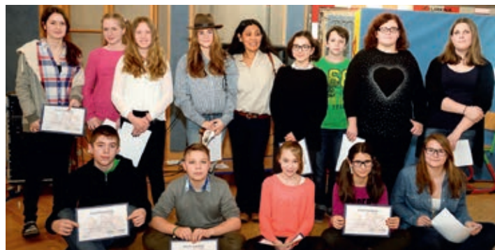
Abschlusspräsentation mit Überreichung der Zertifikate

Fremdsprache auszudrücken, werden sicherer im Gespräch und erhalten zusätzlich einen Blick über den eigenen Tellerrand, zumal die Lehrer aus verschiedenen Ländern und Kulturen kommen“, fügt Bauer hinzu. Alles in allem eine sehr erfolgreiche und abwechslungsreiche Woche.