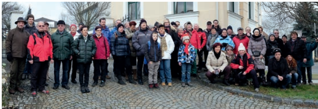
Die Teilnehmer an der Neujahrswanderung

Die Mitglieder der Wandergruppe des Pensionistenverbandes Hadersdorf & Umgebung schlossen sich auch heuer am Neujahrstag den Straßer Armbrustschützen an und wanderten mit ihnen über den Manhartsberg zur Labestelle, dem Schützenhaus. Nach der Stärkung ging es durch das Straßertal zurück zum Ausgangspunkt.