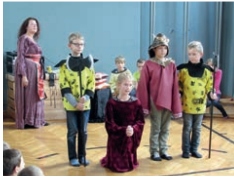
Musiktheatergruppe „Kinder des Olymp“