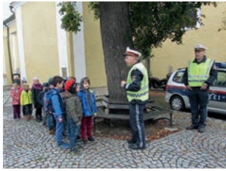
Verkehrserziehung für die 1. Klasse