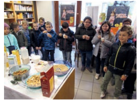
Besuch in der Apotheke