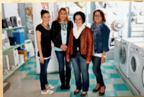
Das Team von EP: Zierlinger Hadersdorf

Wir danken unseren Kunden und wünschen Frohe Weihnachten und einen guten Rutsch ins neue Jahr!