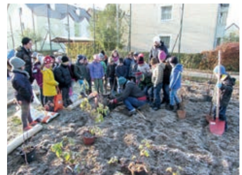
Einsatz und Fleiß beim Pflanztag