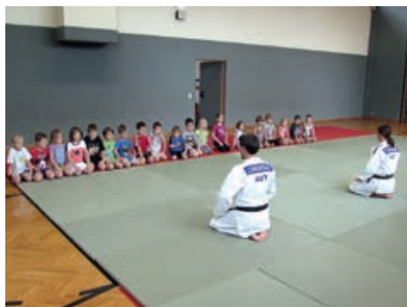
Judo-Schnuppertraining 1. und 2. Klasse