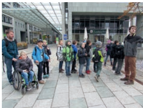
Besuch in der Landeshauptstadt St. Pölten

Die Schülerinnen und Schüler der 2. und 3. Klasse der Volksschule Hadersdorf-Kammern durften am 4.11.2016 im Rahmen der Förderaktion zur Gestaltung von Schulfreiräumen mit 2 Vertreterinnen der NÖ Landesregierung aktiv am Pflanztag bei der Gestaltung mitarbeiten. Alle Kinder waren mit großer Einsatz und Fleiß dabei und bei einigen zeigten sich bereits Ansätze für „grüne“ Daumen.