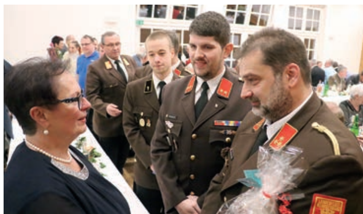
Die Funktionäre beider Feuerwehren und der Vereine unserer Marktgemeinde, bildeten einen langen Gratulantenreigen.