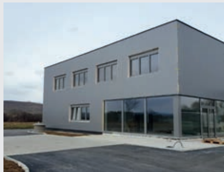
Die Firmen D-Life (links) und Zierlinger (rechts) werden noch heuer ihre Geschäfte eröffnen.