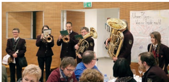
Der Musikverein Hadersdorf-Kammern stellte sich zur Überraschung der Jubilarin mit einigen Musikstücken ein.

gen unserer Bürgermeisterin hervorhob und ihr die Glückwünsche der Frau Landeshauptfrau überbrachte. Den Abschluss bildeten die Dankesworte der Jubilarin, an deren Ende sich ein langer Reigen von Gratulanten bildete.