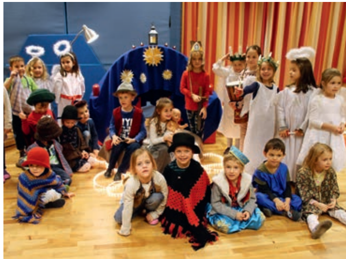
Schlussfoto bei der Krippe mit allen Darstellern.

rührend und stimmungsvoll. Jedes Kind hatte eine wichtige Rolle.