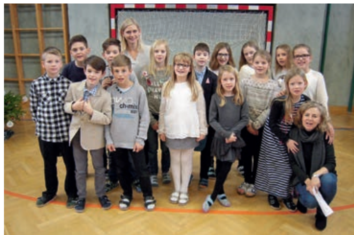
Die Schauspieler mit ihren Lehrerinnen

Nahtstellenarbeit heißt das Zauberwort, das die gute Zusammenarbeit zwischen den Schulen bezeichnet. Eine dieser tollen Partnerschaften wurde im Rahmen der Weihnachtsfeier im Turnsaal der Volksschule Strass mit der Aufführung eines Märchens gefeiert.