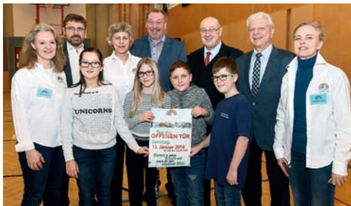
Sichtlich zufriedene Gesichter seitens der Kinder, Lehrer und schulverantwortlichen Entscheidungsträger

Zahlreiche Schülerinnen und Schüler aus den 3. und 4. Klassen verschiedener Volksschulen und auch „Ehemalige“ besuchten die NMS und PTS Grafenegg. Neu war in diesem Jahr, dass Unterricht für alle an einem Samstag zu sehen war. Vor zehn Jahren noch üblich, ist der Samstag seither allgemein unterrichtsfrei. „Für uns Eltern ist das sehr angenehm“, meinte eine Mutter begeistert. „Da haben wir genug Zeit, uns gemeinsam mit unserem Kind