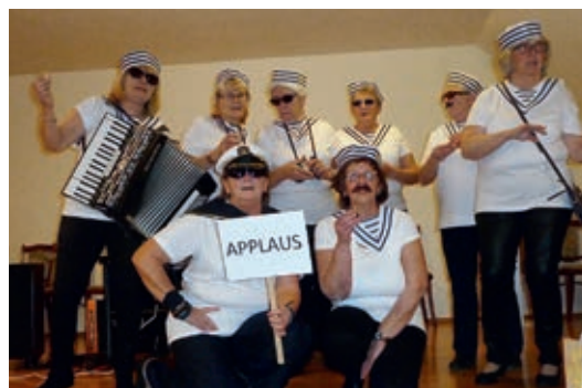
Lustige Darbietungen einiger Mitglieder gab es bei der Faschingsfeier.