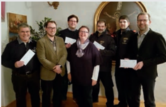
Die Spenden anlässlich meines Geburtstages wurden an vier Vereine aufgeteilt.