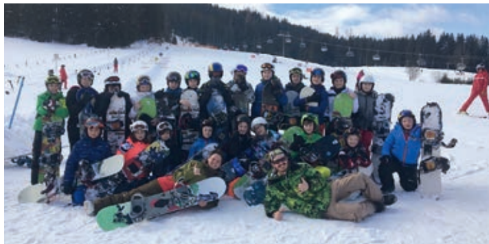
Die Snowboardgruppe hatte sichtlich Spass

Bevor es in die Semesterferien ging traten 68 Schüler der NMS Grafenegg gemeinsam mit acht Betreuern die Reise nach Eben im Pongau an.