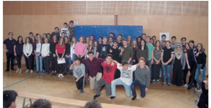
Schlussbild der Teilnehmer und Nativespeaker im Turnsaal

Vom 29. Jänner bis 2. Februar 2018 nutzen 57 Schüler der 4. Klassen das Angebot, ihre Englischkenntnisse bei der Englisch-Projektwoche mit ABCi zu verbessern. Native Speaker aus unterschiedlichen englischsprachigen Ländern (USA, England, Australien) arbeiteten mit unse-